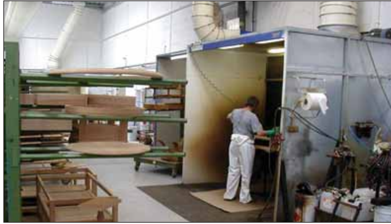
La société Motard a implanté une nouvelle usine sur le site industriel de la Verrie.

Grâce à l'action de la SODEV durant les sept dernières années, 30 entreprises ont ainsi rejoint la Vendée. Cette société d'économie mixte est en effet chargée de la promotion du