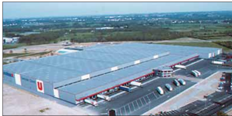
La plate-forme de 75 000 m 2 permettra la création de 200 emplois.

implantation vu le nombre de candidats qui s'étaient fait connaître pour recevoir la plate-forme. Mais le vendéopôle correspondait parfaitement aux attentes de Systeme U avec une qualité de vie et un positionnement exceptionnels : situé dans le haut bocage et recouvert à 30% par des espaces verts, le vendéopôle aura un accès direct à l'A87 et