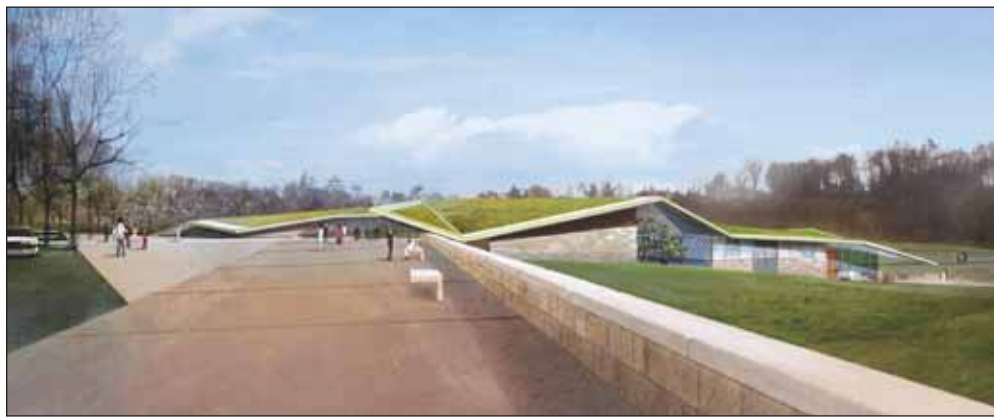
Historial, dont les travaux viennent de commencer, ouvrira au public en juillet 2005.