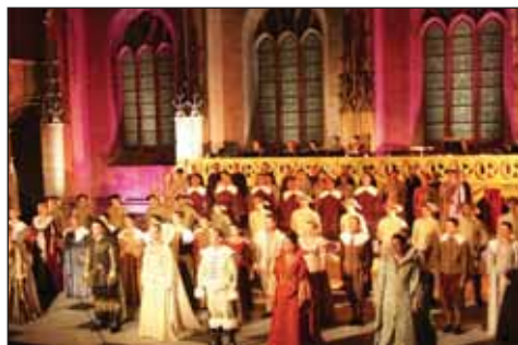
La pièce Europe jouée à Luçon a fait carton plein.

A n'en pas douter, c'est bien le millénaire de Maillezais qui s'est installé tout en haut du podium de cette saison culturelle. Un spectacle grandiose qui a conquis plus de sept mille spectateurs, par sa mise en scène à couper le souffle, des moyens techniques de pointe, une musique saisissante servie par des textes magnifiques... Rien ne manquait à ce spectacle qui a rencontré un succès unanime. A