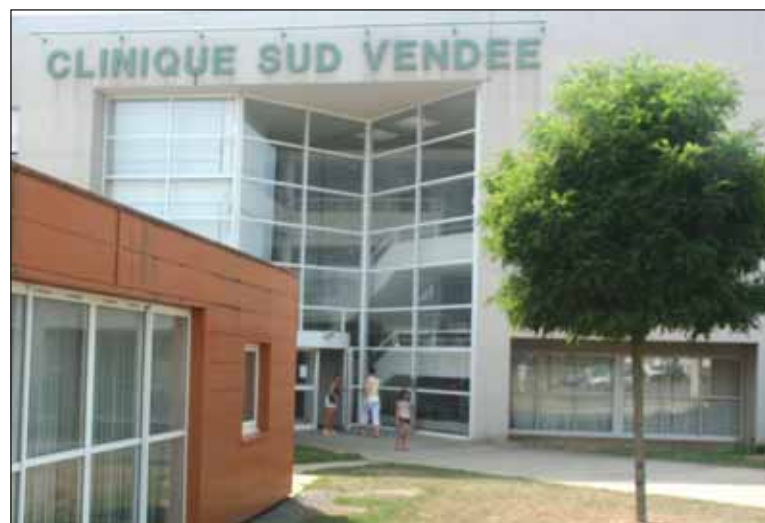
Les travaux de la clinique sont terminés depuis avril.

La clinique se spécialise donc dans la chirurgie. Des travaux récents, cautionnés par le Conseil Général, lui ont permis de s'équiper dans ce domaine. Six chirurgiens, sept anesthésistes, une vingtaine de spécialistes et cinquante infirmières constitueront l'équipe de ce pôle déjà en fonction-