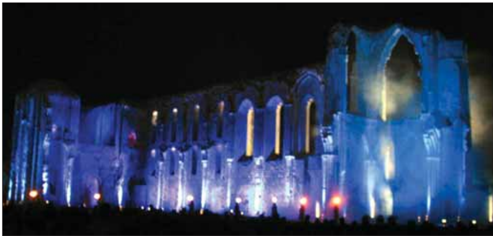
Devant le succès rencontré, le spectacle "Maillezais, lumière du Marais" sera reconduit en 2004.

tel point qu'il a toutes les chances d'être reconduit chaque année pour devenir un événement incontournable et s'installer définitivement dans le paysage culturel vendéen.