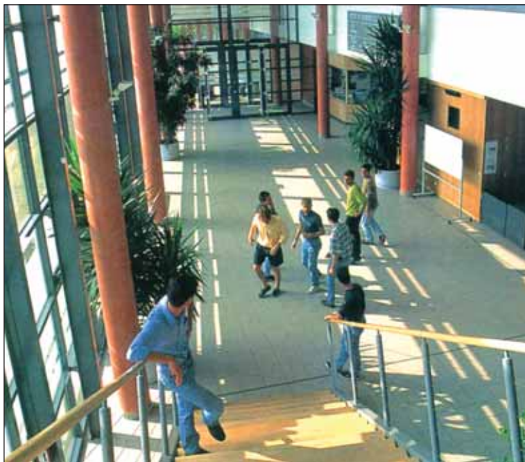
En 2003, une dizaine de formations supérieures a été créée en Vendée.

Plus de 7 000 étudiants vont bientôt faire leur rentrée en Vendée. Cette année, de nouvelles filières s'ouvrent à eux. Un effort par-