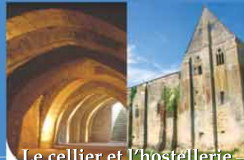
Le cellier et l'hostellerie

Le cellier, qui servait de fondation au réfectoire, est très bien conservé. Havre de fraîcheur en plein été, sa voûte en berceau brisé du XII ème siècle vaut le détour. Les bâtiments de l'hostellerie qui datent du XIV ème siècle sont aussi bien conservés. Dortoir, réfectoire pour les hôtes... Ils soulignent le rôle d'accueil des pauvres et des pèlerins de cette abbaye.