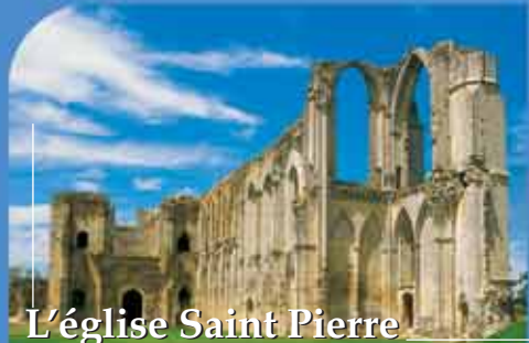
L'église Saint Pierre

Aujourd'hui église de verdure, celle qui fut cathédrale n'a conservé que deux murs. On peut cependant se rendre compte de la surface au sol et de la somptuosité des différents choeurs qui la constituaient. Sur l'imposant mur de la nef, qui domine toujours le marais, on lit les aménagements successifs qui modelèrent le plus bel édifice du Poitou.