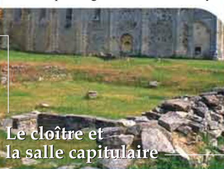
Le cloître et la salle capitulaire

Depuis le début de l'été, on peut découvrir le tracé au sol du cloître, lieu de prière pour les moines. Un peu plus loin, la salle capitulaire, qui a aussi disparu, accueillait quotidiennement les moines qui avaient "voix au chapitre". C'est là qu'ils prenaient les décisions pour organiser la vie de l'abbaye.