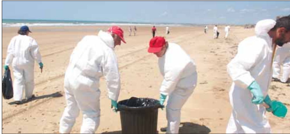
Les brigades parviennent à nettoyer les plages en seulement quelques heures.

Cependant les boulettes apparaissent peu fréquemment, et sont dans l'ensemble très clairsemées.