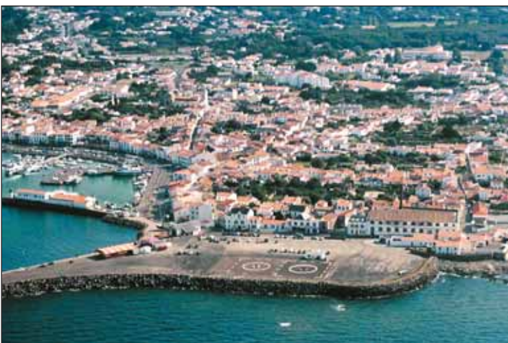
Un périmètre de sécurité va être installé sur l'hélistation de Port-Joinville.