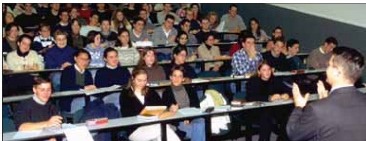
En douze ans, 4 000 étudiants ont été formés à l'ICES.

Cette nouvelle "école des Masters" prolonge "l'école universitaire", concept sur lequel l'ICES fut fondé en 1989. Une formule originale et innovante, à la croisée de l'université et de la classe préparatoire, qui explique le succès incontestable de l'établissement : 4 000