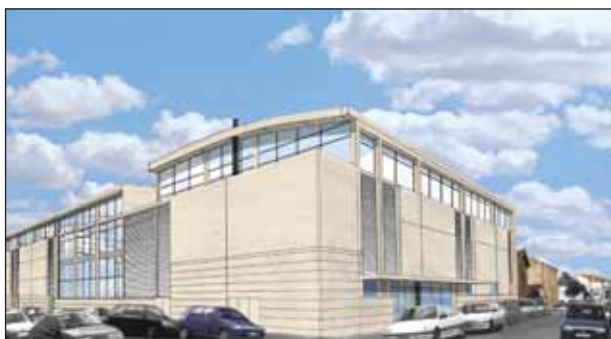
Le gymnase pourra accueillir 150 élèves en même temps.

doubler la surface existante, avec pour objectif de s'adapter au plus près aux besoins exprimés par les professeurs d'EPS, qui privilégient dans leur enseignement les disciplines collectives", explique Michèle Peltan, conseillère générale de La Roche-sur-Yon sud. C'est pourquoi le bâtiment comptera deux gymnases (1 056 m 2 et 540 m 2 ) dédiés aux sports collectifs comme le hand-ball, le basket ou le volley, et deux salles spécialisées (570 m 2 et 270 m 2 ) équipées pour la pratique des sports de combat et de la gymnastique.