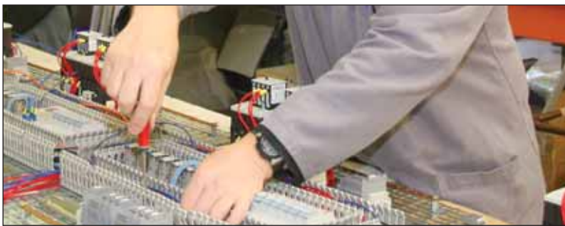
Des emplois manuels ne trouvent pas preneurs.

Pour atteindre ces objectifs, cinq chargés de mission arpenteront le terrain à l'écoute des besoins. Besoins des entreprises qui ne trouvent pas d'employés formés aux métiers pour lesquels elles recrutent. Besoins des demandeurs d'emploi qui ne trouvent pas d'offre de travail