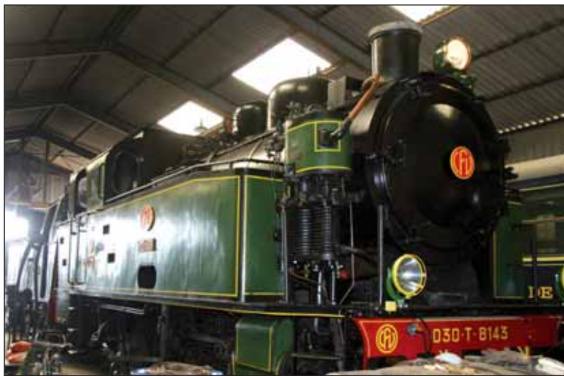
Delphine est une locomotive de 1945. C'est le nouveau fleuron du Chemin de Fer de Vendée.

« Chaque été, nous faisons circuler des trains, avec notre wagon