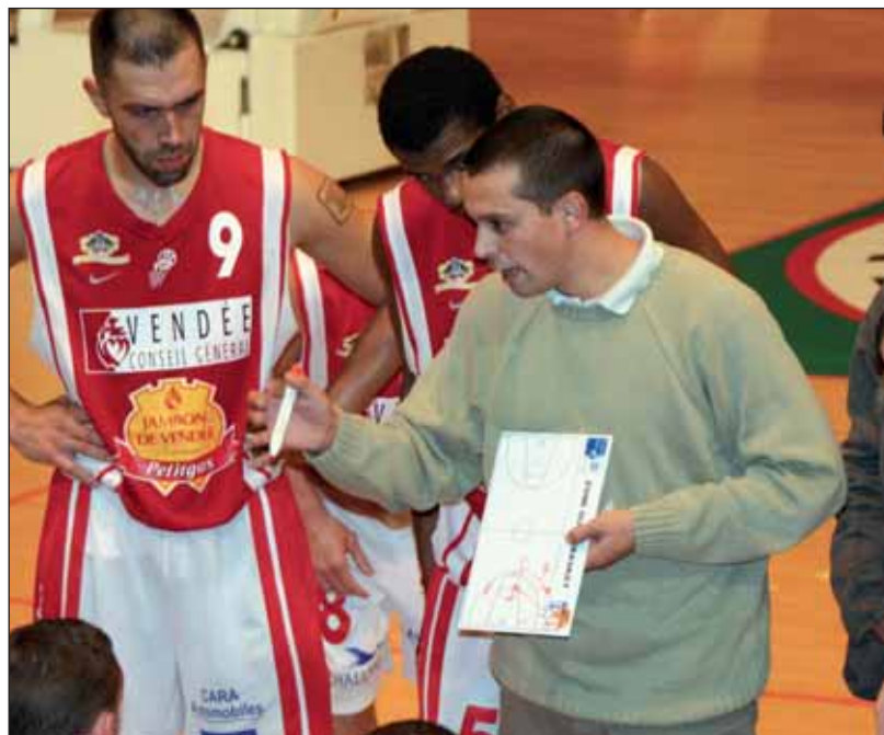
Le Vendée Challans Basket a entrepris de s'élever dans la hiérarchie nationale, entraînant derrière lui tout le basket vendéen.

Nul doute que l'équipe des féminines de La Garnache, qui est descendue en NF3, saura pour sa part trouver un nouveau souffle. Son centre de formation lui permettra très certainement de rebondir pour remonter en N2.