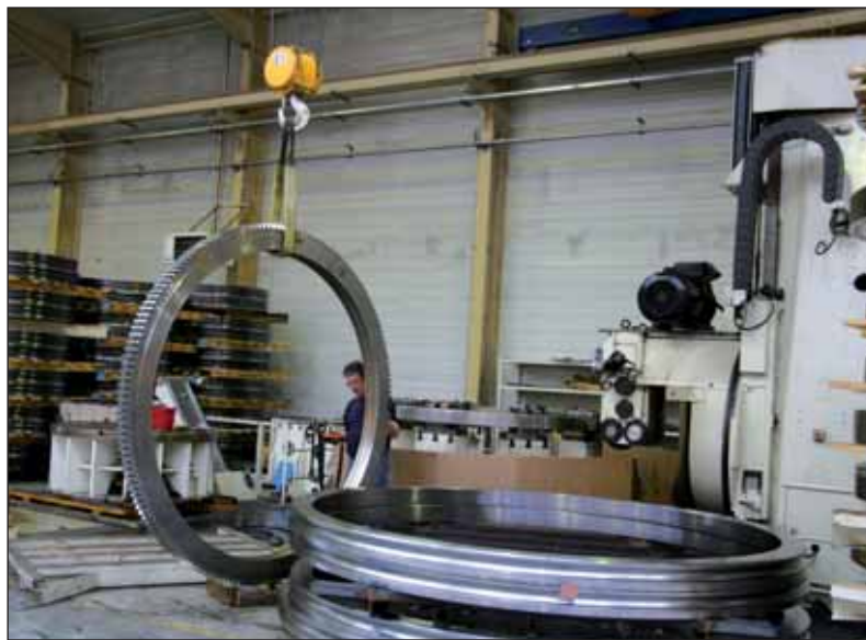
Chaque année des milliers de couronnes sont fabriquées à La Bruffière par Defontaine.

Désormais, l'entreprise de la rue Saint-Éloi, patron des forgerons, emploie 1 100 personnes sur le site de la Bruffière. Chaque année sortent de ses forges 30 000 à 40 000 couronnes d'orientation qui peuvent mesurer jusqu'à quatre mètres de diamètre et peser cinq tonnes. Chaque année, l'entreprise enregistre un taux de croissance d'environ 15 à 20 %. Et, chaque année, l'entreprise embauche de nouveaux employés. « En 2006 nous avons accueilli une centaine de nouveaux salariés. Dans les cinq ans qui viennent nous pro-