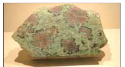
Un éclat d'éclogite visible à l'Historial de la Vendée.

d'éclogite. Ils ont pu admirer le remarquable travail effectué par le Conseil Général, notamment dans les domaines de la diffusion de l'histoire géologique du département et dans la valorisation de la diversité géologique vendéenne.