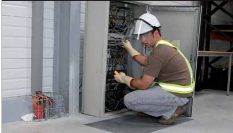
Conseil Sécurité Formation donne des conseils aux entreprises et aux collectivités.