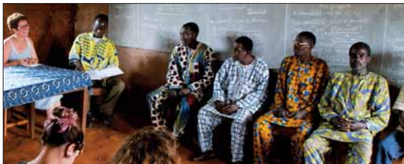
Les habitants de Toviklin ont une part active dans l'ouverture de l'orphelinat, comme dans la construction de leur école.

■ NonzoBénin, 1, route d'Auzay, 85200 Chaix. Tél. : 06 08 61 37 89