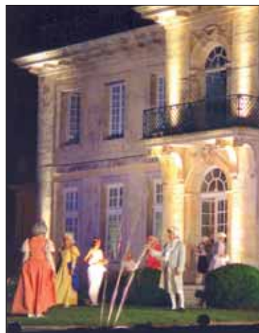
Les acteurs de l'association ACSO d'Olonne-sur-Mer illuminent chaque été le château de Pierre-Levée.