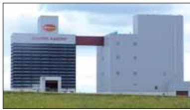
Le nouveau moulin de la Minoterie Planchot a été inauguré à la rentrée

Créée en 1912, la société Planchot, qui s'appelait autrefois Planchot-Fillon, a connu une progression et une réussite constantes, symbolisées