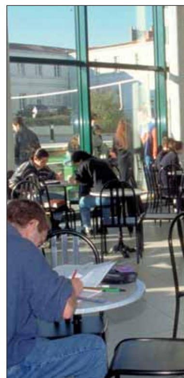
Plus de 800 étudiants font leur rentrée à l'ICES.