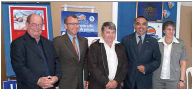
Le Marin Vendéen, entreprise d'Aizenay a signé un partenariat avec Cusimer, entreprise de Gaspésie.

Mardi 11 septembre, Le Marin Vendéen, entreprise d'Aizenay spécialisée dans la fabrication de plats cuisinés à partir de poisson, et Cusimer, société de Montlouis, en Gaspésie, ont signé un partenariat de transfert de compétences. La société agésinate a ainsi donné le coup d'envoi des échanges économiques entre la Vendée et la région québécoise « Gaspésie Iles de la Madeleine ». « Cette entente s'est nouée dans