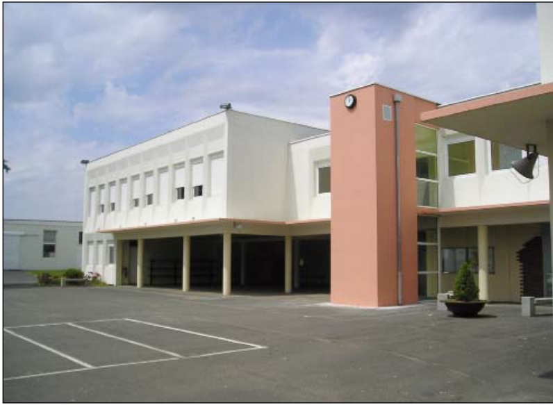
Les locaux de cuisine du collège de La Châtaigneraie ont été rénovés durant l'été.

Avec la rentrée 2008, de nouveaux chantiers et projets de réhabilitation et de modernisation sont lancés dans les collèges du département. Le collège Édouard Herriot de La Roche-sur-Yon fait partie des projets les plus importants pour les mois qui viennent.