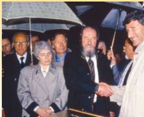
A. Soljenitsyne, lors de l'inauguration du Mémorial des Lucs-sur-Boulogne en 1993.