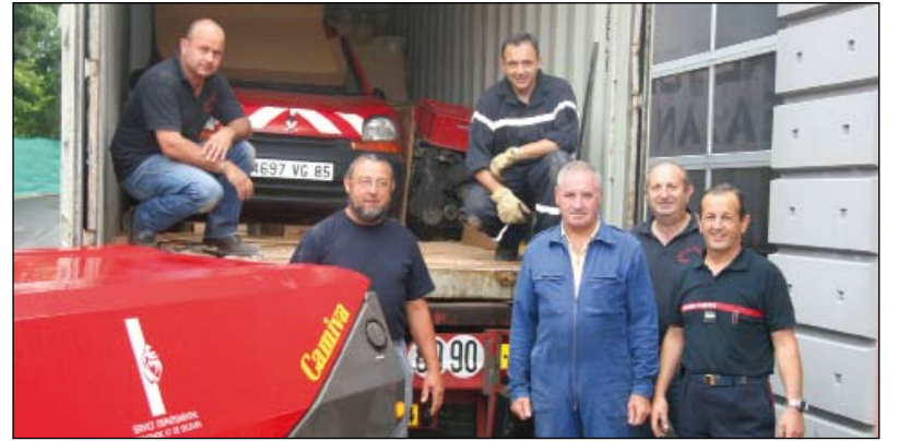
Le conteneur préparé par les pompiers de Vendée prêt à partir pour Tananarive à Madagascar.