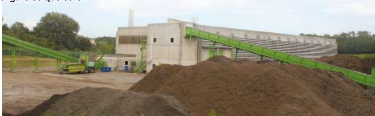
Zone d'affinage et de stockage du compost au centre de Tri Mécano Biologique, le Creusot Montceau Recyclage.

Depuis la mise en marche de l'unité de Tri Mécano Biologique, les habitants de la communauté urbaine du Creusot-Montceau ont vu la différence : « Ce nouveau site est utile pour l'environnement, témoigne Liliane, domiciliée au Creusot. Personnellement, il m'a incitée à faire le