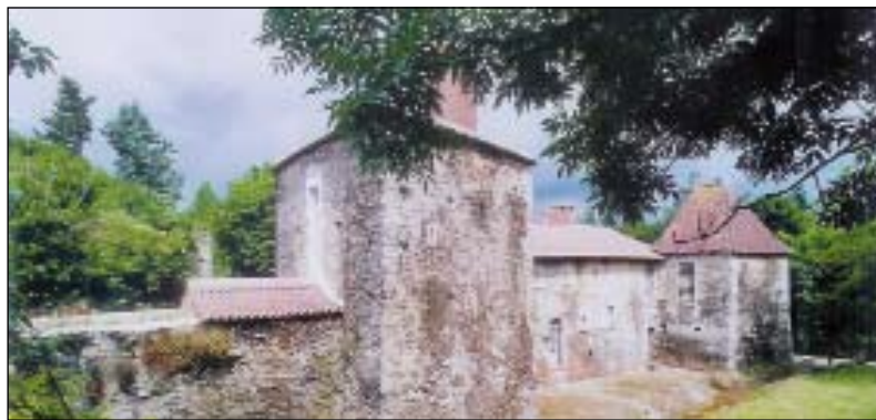
Le logis de La Boislinière à Rochetrejoux fait partie des édifices rénovés grâce à la fondation.

■ Renseignements : 02 51 62 00 35 www.fondation-patrimoine.com