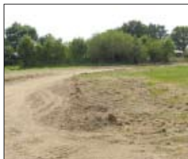
Seules des fouilles approfondies pourront confirmer l'hypothèse d'avoir mis à jour une capitale celtique du VII e siècle av. JC à Mervent.

Les écrits historiques recouperaient ces découvertes. Ces types de sites sont assez rares. Les Gaulois s'y organisaient en société en temps de paix. Une dizaine d'entre eux se trouverait dans la région des Pays de la Loire. Seules des fouilles approfondies détermineront la richesse du site gaulois de Mervent.