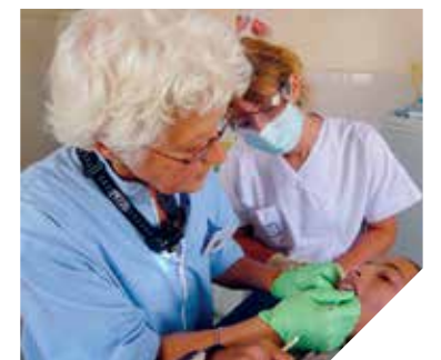
Des dentistes vendéens vont régulièrement au Maroc pour prodiguer leurs soins aux plus démunis.