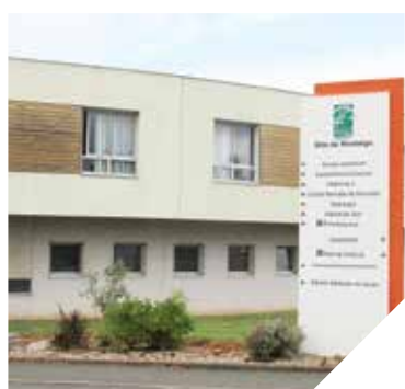
Le site hospitalier de Montaigu sera bientôt équipé d'un scanner.

L'ARS (Agence Régionale de Santé) a donné son accord cet été pour l'installation d'un scanner sur le site de Montaigu.