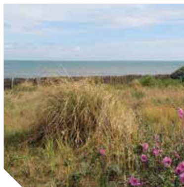
À Saint-Vincent-sur-Jard, découvrez le jardin « impressionniste » de Clemenceau.

sionniste » vous invite à la contemplation. La maison de Clemenceau, qui fait face à l'océan, est