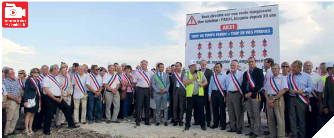
Lors de la mobilisation du 25 juillet dernier à Sainte-Gemme-la-Plaine, élus et chefs d'entreprise ont dévoilé quatre grands panneaux: « A 831, trop de temps perdu = trop de vies perdues » pour sensibiliser les automobilistes à la nécessité de construire l'A 831.

Malgré la volonté de la Ministre de l'Écologie, Ségolène Royal, de bloquer le projet de l'A 831, fin juillet, le Premier Ministre a finalement rendu un arbitrage favorable sur la poursuite de la procédure.