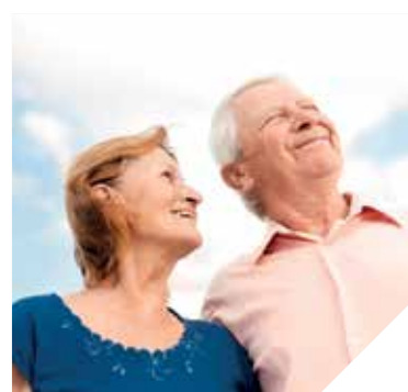
Le bilan prévention et anticipation de la dépendance est gratuit et confidentiel. Il est proposé aux 55/70 ans.