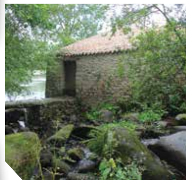
Le moulin à foulon de Cugand est niché au bord de la Sèvre nantaise.

mont des Alouettes, aux Herbiers. À Cugand, les visiteurs peuvent découvrir, au cœur d'un espace naturel sensible, les vestiges d'un moulin à foulon, rare témoin de l'exploitation hydraulique de la Sèvre nantaise entre le Moyen Âge et le milieu du XX e siècle.