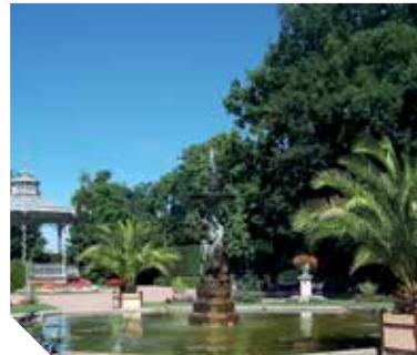
Le jardin Dumaine à Luçon est un bel exemple de jardin public de la fin du XIX e siècle.

En Vendée, patrimoine culturel et patrimoine naturel ont toujours fait bon ménage. Pour ces Journées du Patrimoine 2014, l'occasion est idéale pour découvrir ou redécouvrir des lieux où les deux éléments se confondent. C'est le cas des parcs et jardins de Vendée. À Bazoges-en-Pareds, un jardin médiéval vous attend ainsi au pied du donjon. Vous y découvrirez les différents carrés : médicinal, potager, aromatique et magique !