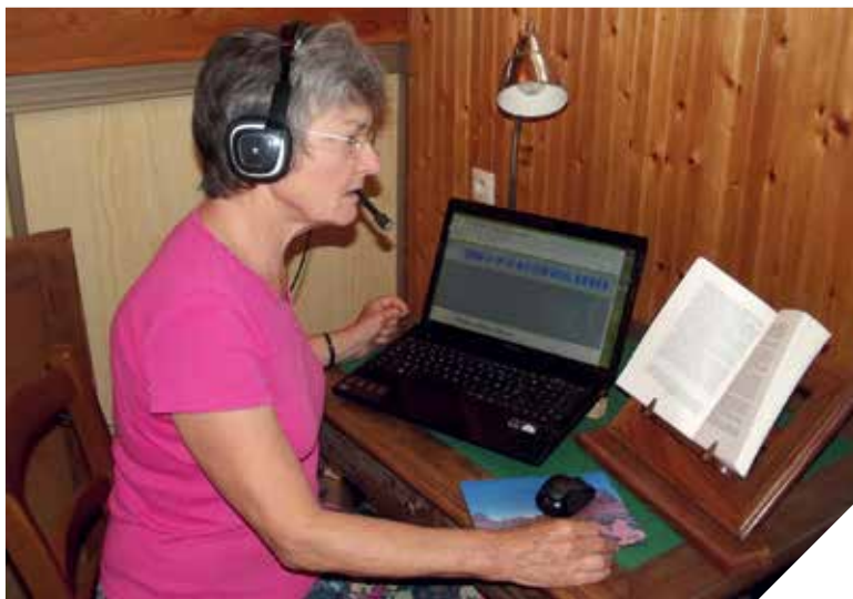
En Vendée, une cinquantaine de bénévoles « prêtent » leur voix pour enregistrer des livres audio.

La Quinzaine du handicap est organisée par les Vendéthèques du département, la MDPH (Maison Départementale des Personnes Handicapées) et plusieurs associations. Ensemble, ils proposent une palette d'animations gratuites, du 9 au 20 septembre, afin de sensibiliser le public au quotidien des personnes en situation de handicap.