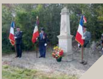
Le Maréchal de Lattre a joué un rôle majeur dans la libération de la France.

nant dans la libération de la France, explique Bruno Retailleau, président du Conseil général. Né et enterré à Moulleron-en-Pareds, le Maréchal de Lattre incarnait parfaitement les valeurs de ténacité et d'unité portées par sa célèbre devise: « Ne pas subir ». Ces valeurs et cet état d'esprit seront également mis à l'honneur lors de la commémoration des 70 ans de la libération de la Vendée. Le 4 octobre prochain, le Conseil général rendra hommage aux combattants vendéens du maquis de La Chapelle-aux-Lys. « À l'image de Jean de Lattre, ces combattants ont choisi la voie de la résistance et de la liberté », poursuit Bruno Retailleau. Une voie qui, plus que jamais, reste d'actualité et doit servir de référence aux jeunes générations.