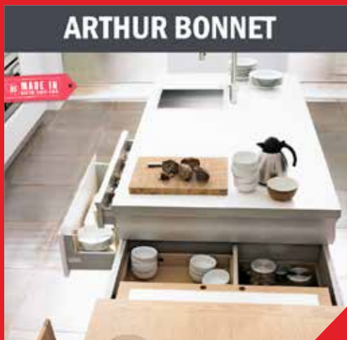
Au départ, simple entreprise vendéenne de menuiserie, la marque Arthur Bonnet est devenue une référence en matière de cuisine. L'exposition « Made in 85 » permet de faire la lumière sur ces belles aventures entrepreneuriales.