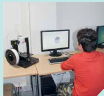
L'imprimante 3D permet de fabriquer une multitude d'objets.

chauffe, le plastique fond et un filament se dépose suivant le