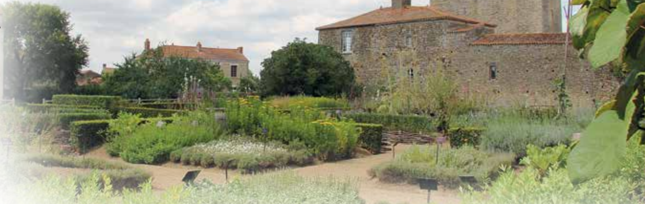
À Bazoges-en-Pareds, le donjon surplombe le jardin médiéval..

Les 20 et 21 septembre prochains, les Journées du Patrimoine mettront à l'honneur la nature. « Patrimoine culturel, patrimoine naturel », tel est le thème d'un week-end qui vous réserve bien des surprises ! Des parcs de châteaux, aux jardins publics, des moulins du bocage en passant par les écluses ou les bourrines des marais, patrimoine et nature se conjuguent à merveille en Vendée.