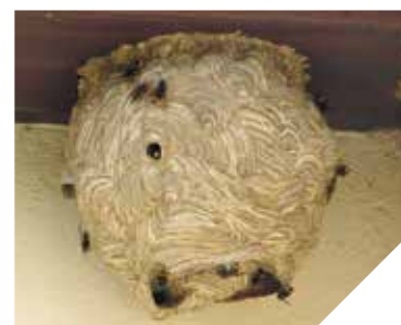
Les frelons asiatiques sont de redoutables prédateurs pour les abeilles.