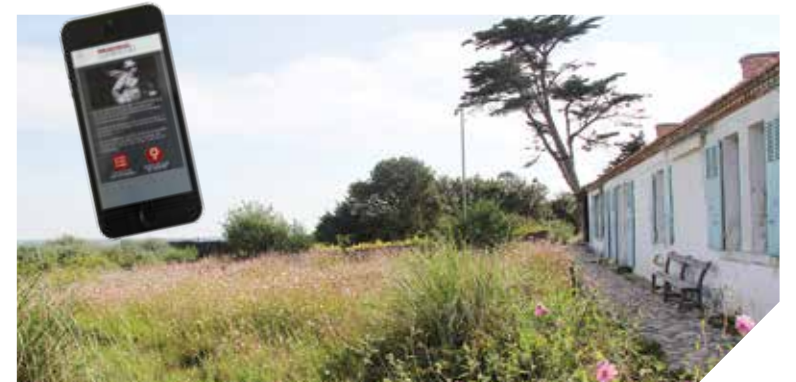
Né à Mouilleron-en-Pareds et enterré à Mouchamps, Clemenceau a marqué de nombreux lieux en Vendée. Ici, sa maison de Saint-Vincent-sur-Jard.

Mouilleron-en-Pareds, Saint-Vincent-sur-Jard, Mouchamps, Sainte-Hermine... Les lieux marqués par Clemenceau sont nombreux en Vendée mais aussi en France. Pour partir à la découverte de ces lieux et découvrir ainsi l'histoire du Père la Victoire, le Conseil général a mis en place une chasse aux trésors des temps modernes sous forme de geocaching. Muni des coordonnées GPS du lieu à trouver, l'utilisateur part à la chasse aux contenus cachés