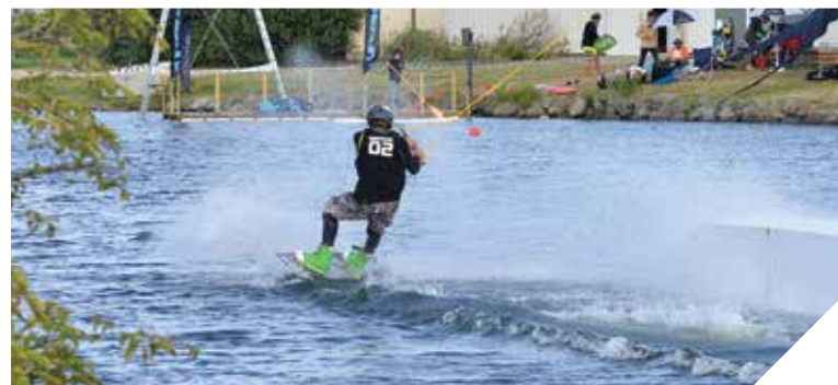
Le wake-park est un véritable terrain de sport et de loisir pour les adeptes des sports de glisse.