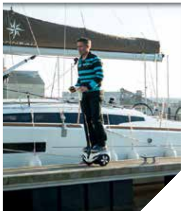
Le gyropode permet de se déplacer trois fois plus vite, sans bruit et sans pollution.