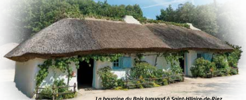
La bourrine du Bois Juquaud à Saint-Hilaire-de-Riez.

Dans le marais breton vendéen, la nature est également au cœur du patrimoine rural local. Ainsi, les bourrines, fabriquées à partir des éléments naturels à disposition (terre pour les murs, roseaux pour la toiture) permettent de découvrir le lien étroit qui unit le patrimoine vendéen à la nature.