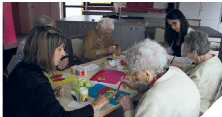
Aux Coquelicots, des ateliers sont mis en place pour les résidents accueillis à la journée.