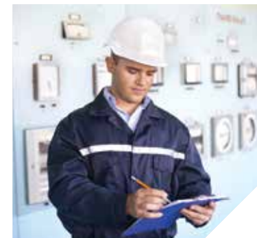
La formation Ingénieur, spécialité systèmes électriques intelligents, prépare à des métiers d'avenir.

Pour cette rentrée 2014, l'antenne vendéenne du Cnam Pays de la Loire propose une formation unique dans la région: « Ingénieur, spécialité systèmes électriques ». Cette toute nouvelle formation s'appuie sur le projet smart grid actuellement en œuvre en Vendée et coordonné par le Sydev. Ce projet, financé au titre des investissements d'avenir, a pour objectif de faire de la Vendée un territoire pilote pour développer les technologies des réseaux électriques intelligents. Des technologies qui permettront de réaliser des économies d'énergie et de mieux gérer production et consommation d'électricité.