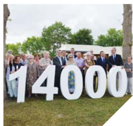
Elus et habitants lors de l'inauguration de la résidence senior L'Orgerie, à Challans.

En effet, l'office public livre en moyenne 300 logements par an. Parallèlement aux projets destinés aux personnes âgées, Vendée Habitat développe une offre très riche, notamment pour les jeunes ménages vendéens. À travers de multiples dispositifs, comme la location-accession, les jeunes à revenu modeste peuvent plus facilement envisager leur avenir en Vendée.