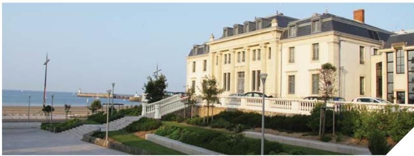
Une centaine de personnes travaillent au Tribunal de Grande Instance des Sables-d'Olonne.

Après des mois de mobilisation et l'intervention de Bruno Retailleau, président du Conseil général, la Chancellerie a annoncé l'abandon du projet de suppression du Tribunal des Sables-d'Olonne. Une victoire pour la justice de proximité.