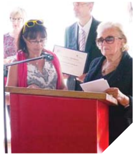
Bernadette Chirac a remis le Prix.

Ce projet a été récompensé par Bernadette Chirac, présidente de la Fondation des Hôpitaux de Paris et de France, qui a choisi de financer la moitié de l'installation de cette initiative et ce, par le biais de l'Opération Pièces Jaunes 2014.