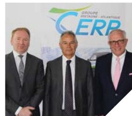
Une trentaine de personnes travaillent pour la nouvelle agence CERP d'Aizenay.

rain pour pouvoir agrandir nos locaux ». Aujourd'hui, l'entreprise développe tout particulièrement une filiale pour le maintien à domicile. Un secteur qui se développe et apporte une importante dynamique à l'entreprise.