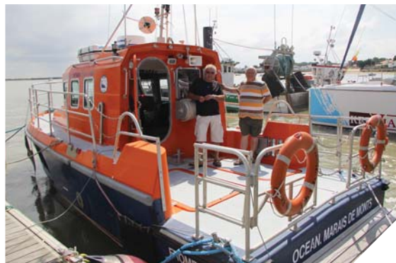
À Fromentine, la station de secours de la SNSM, créée en 2001, compte dix-huit bénévoles actifs.

Tout au long de l'année et sur toute la côte vendéenne, les bénévoles de la SNSM sont prêts à secourir marins professionnels et plaisanciers en détresse. Grâce à leurs compétences et leur dévouement, de nombreux drames sont évités. Rencontre avec des sauveteurs de Fromentine.