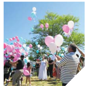
Chaque année, Hespéranges organise un lâcher de ballons en l'honneur des enfants décédés.

EHPAD / LA MOULINOTTE À SAINT-HILAIRE-DES-LOGES