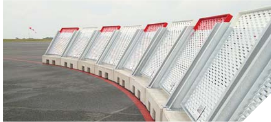
Des pare-souffles construits par Cartel Manutention sont en place à l'aéroport de La Rochelle.

De l'élevage aux aéroports, il n'y a qu'un pas pour le groupe Cartel. Spécialisée dans le machinisme agricole, l'entreprise vendéenne part aujourd'hui à la conquête du marché aéroportuaire. Et déjà quelques beaux succès sont au rendez-vous. De Roissy au Qatar, des engins Cartel, développés et construits à Chavagnes-les-Redoux, vous aideront peut-être à partir en vacances.