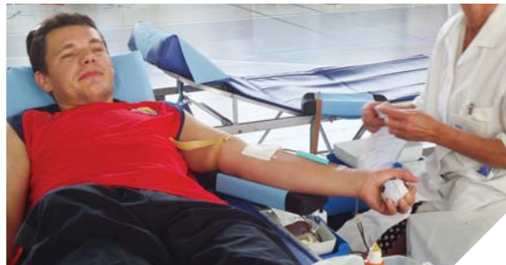
L'Établissement Français du Sang incite les bénévoles à donner leur sang durant la période estivale afin de pallier les manques.

Pour pallier tout manque, l'Établissement Français du Sang, et