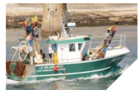
La pêche française serait touchée de plein fouet par la nouvelle mesure de la Commission européenne.

dû subir, ces dernières années, l'interdiction du filet maillant dérivant pour le thon, le requin-taupo et la raie brunette. Conséquence de cette véritable politique de démantèlement : 30 % des navires ont disparu en 10 ans. Face à ce nouveau coup dur en perspective, le Conseil Général a voté une résolution pour demander au gouvernement de faire échouer, à Bruxelles, ce nouveau projet d'euthanasie de la pêche artisanale française.