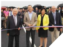
Fin juin, les élus ont inauguré le contournement sud des Herbiers.

Et pour aller encore plus loin, le Département, qui a financé en totalité ces travaux, a équipé cette nouvelle route de fourreaux destinés à la desserte en très haut débit du bocage.