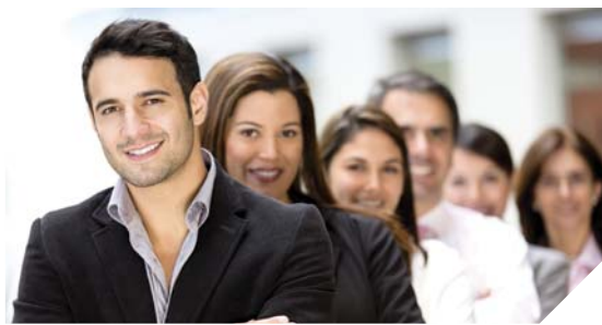
Selon l'INSEE, la Vendée devrait accueillir 45 000 nouveaux actifs d'ici à 2030.

des actifs plus âgés aux plus jeunes. Pour cela il faut qu'elles puissent s'appuyer sur des dispositifs de formations adaptés. Dans ce sens, l'accompagnement de l'insertion professionnelle des jeunes par les pouvoirs publics est déterminant pour le développement du territoire », précise Wilfrid Montassier. Plusieurs secteurs économiques sont particulièrement porteurs selon l'étude : la métallurgie, la fabrication des matériels de transports dans l'industrie, les activités de soutien aux entreprises (activités juridiques et comptables notamment), ou encore ce qui est appelé l'économie résidentielle, c'est-à-dire les commerces et services à destination des personnes.