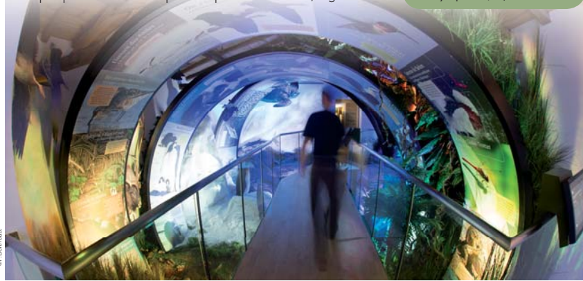
Dernière saison pour profiter de l'exposition sur les migrations animales les plus insolites à la Cité des Oiseaux.