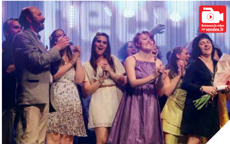
Pour terminer la soirée, tous les Cœurs d'or de cette année et de l'année dernière se sont retrouvés sur scène et ont entonné ensemble un air des Beatles. Un grand moment !