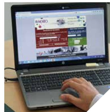
Sur la base de données RADdO, les associations peuvent regrouper leurs archives audiovisuelles et iconographiques.

ÉCHANGES / L'ANNÉE DU LAOS SE PRÉPARE EN VENDÉE