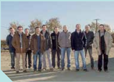
Dix agriculteurs portent le projet.

À la tête du site de méthanisation AgriBioMéthane, ils sont dix agriculteurs du secteur de Mortagne-sur-Sèvre. En quelques années, ils ont réussi à bâtir un projet à la pointe du développement durable. Leur site est alimenté par les effluents de leurs élevages mais aussi par les déchets