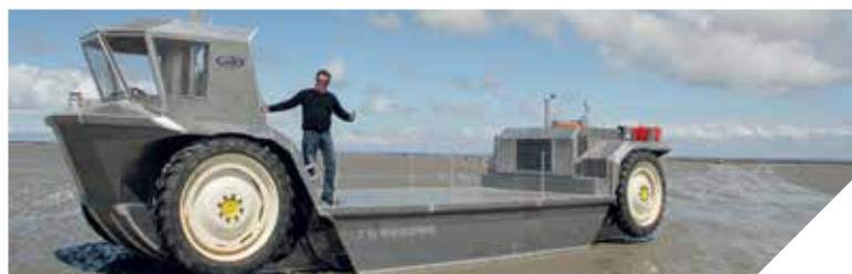
Le Stereden fait ses premiers essais au niveau du Gois: résultats positifs!