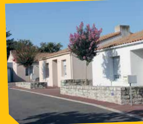
L'habitat est un enjeu majeur dans le domaine des économies d'énergie.

miné du département, cette action pourra être étendue à l'ensemble de la Vendée.