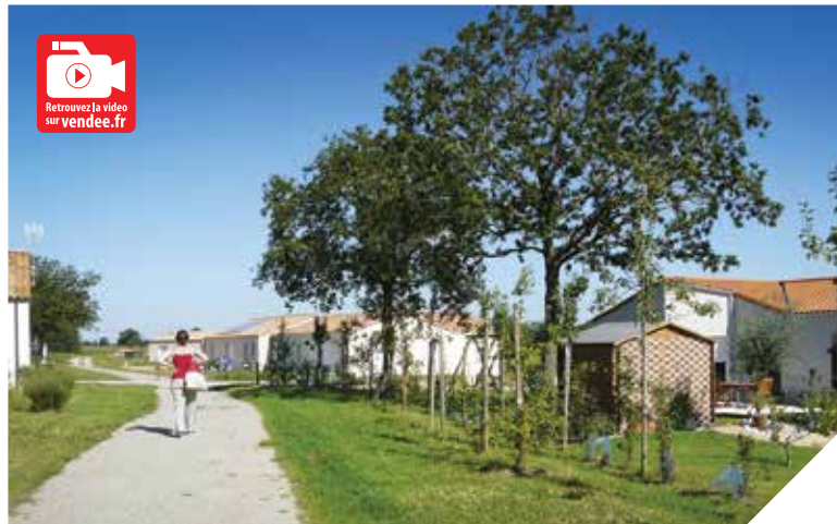
L'éco-quartier de La Papinière, à Treize-Septiers, illustre bien ce que le Département souhaite développer à travers son Plan « Pour un nouvel urbanisme en Vendée ».

Début juin, deux nouvelles communes, Aizenay et Saint-Florent-des-Bois, ont signé un Contrat Communal d'Urbanisme avec le Conseil général. Une étape de plus du Plan « Pour un nouvel urbanisme en Vendée » qui entre désormais dans sa phase opérationnelle. Explications.