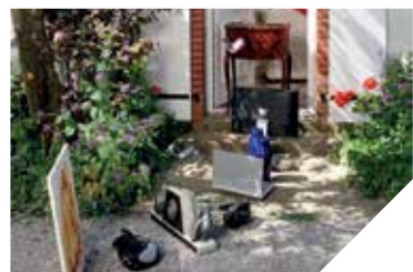
Le site objets-voles.fr est opérationnel.

Faute d'informations sur les objets volés, la Gendarmerie ne peut pas toujours identifier leurs propriétaires et restituer leurs biens. C'est pour cela que la Gendarmerie s'est jointe à la Chambre profession-