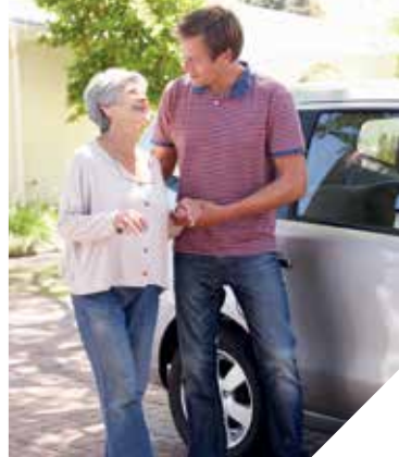
Le plan Vendée double cœur vise à encourager le bénévolat en Vendée.

Renseignements: télécharger le règlement complet et le dossier de candidature sur vendeedoublecoeur.vendee.fr , 02 51 34 47 00, vendeedoublecoeur@vendee.fr