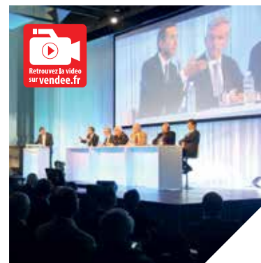
Le Forum a réuni plusieurs centaines de personnes aux Sables d'Olonne.

confortant les atouts traditionnels comme la pêche, l'ostréiculture ou l'aquaculture et miser sur les activités d'avenir comme la construction navale, l'éolien en mer ou les biotechnologies. Et la mentalité vendéenne, qui privilégie l'initiative, est un atout précieux pour répondre à ces enjeux ».