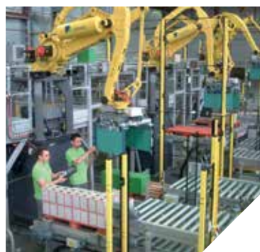
L'entreprise Cermex recrute principalement des automaticiens et électromécaniciens.

À Saint-Laurent-sur-Sèvre, l'entreprise Cermex ne connaît pas la crise. Cette société, spécialisée dans la production de robots et automates pour la mise en palette, connaît une belle croissance, notamment grâce à une présence grandissante à l'international.