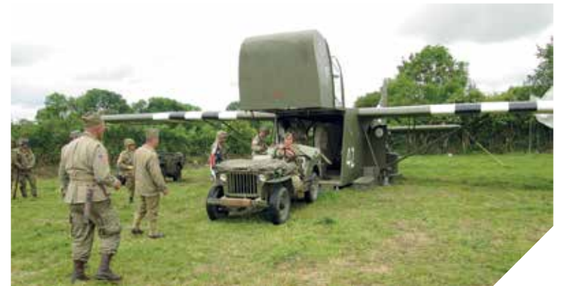
Trois ans ont été nécessaires à ces neuf passionnés pour construire le Waco à l'échelle 1.

Renseignements : https://www.facebook.com/LesDiablesRouges508thPir82ndAirborneVendee