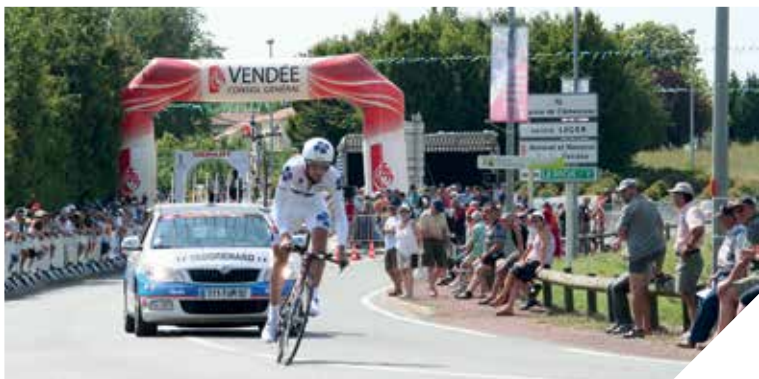
Chantonay s'impose comme une place forte du vélo en France. En 2015, elle accueillera pour la troisième fois les championnats de France sur route.

Pour la cinquième fois en vingt ans, les Championnats de France de cyclisme sur route se dérouleront en Vendée. Et c'est Chantonay qui va accueillir la compétition en 2015 après l'avoir reçue en 2006 et 2010.