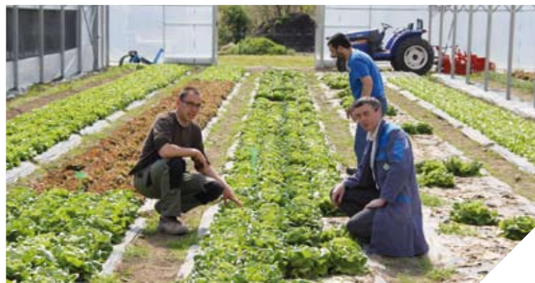
Quand ils ne sont pas à l'atelier de menuiserie, les douze salariés de Bâti-Insert cultivent un vaste potager dont les légumes sont revendus à des collectivités ou des revendeurs.

Aujourd'hui, Bâti-Insert propose 12 postes sur deux chantiers, menuiserie et maraîchage. « Nous avons ouvert ce chantier de maraîchage pour que les personnes aient une plus grande ouverture et ne soient pas cantonnées dans un atelier.