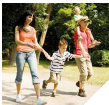
Le Secours Catholique se mobilise pour offrir des vacances à tous les enfants.

En France 2 millions d'enfants vivent sous le seuil de pauvreté. En lien avec plus de 600 000 enfants, par le biais de ses activités, le Secours Catholique développe