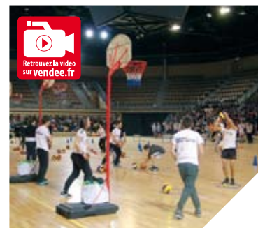
En avril, 1 100 collégiens ont participé à « Vendéfis » au Vendéspace.

faisant preuve de créativité et mettre en avant les richesses de chaque établissement scolaire participant. Dix-sept collèges du département participent et les internautes ont jusqu'au 23 mai 2014 pour voter pour leur clip préféré sur: parlemoi-detoncollege.vendee.fr .