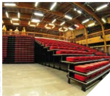
C'est par l'innovation permanente que Master Industrie connaît une forte croissance.