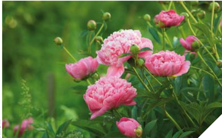
Fleur coupée traditionnelle de plein air, la pivoine connaît un fort engouement ces dernières années.

Sarah Bernardt, Reine Hortense, Laura Dessert... Autant de noms qui font référence à la reine des fleurs : la pivoine. Depuis quelques années, la Vendée est devenu un haut lieu de la culture de cette fleur. Au Gué-de-Velluire, le producteur Vendée Fleurs mise particulièrement sur la pivoine qui fleurit pour la fête des mères en Vendée.