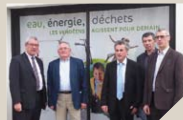
Les responsables de l'ADILE, du Conseil général, du Sydev, de Trivalis et de Vendée Eau.

Renseignements: www.adil85.org (inscription jusqu'au 30 juin)