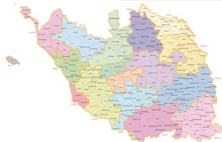
La nouvelle carte cantonale ne respecte pas les bassins de vie de Vendée.

Cette réforme met en lumière l'instabilité des projets de réforme qui concernent les collectivités. La clause de compétence, après avoir été rétablie, est à nouveau mise en cause. Les Départements ont été confortés avant d'être menacés de disparition pour 2021. « Supprimer le Département est une solution en trompe l'œil, explique Bruno Retailleau. Les Conseils généraux remplissent des missions essentielles: routes, collèges, solidarité. Ces compétences devront être assurées quoiqu'il arrive ».