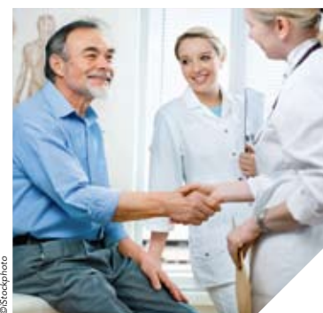
Différents spécialistes auscultent chaque patient pour trouver les solutions qui lui permettront d'améliorer son autonomie.

SOLIDARITÉ / ACCUEIL FAMILIAL DE VACANCES