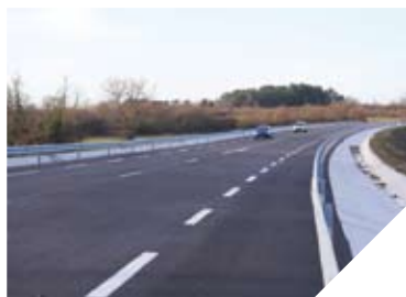
Le nouveau contournement d'Olonne-sur-Mer va donner de l'oxygène au centre-ville.

la Burguinière et celui de Pierre Levée et une seconde entre ce dernier giratoire et celui de la Brochetière.