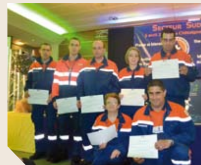
L'Assemblée générale de la Protection Civile a été l'occasion de récompenser des secouristes bénévoles pour leurs années de service.

Il y a quelques semaines, c'est à La Châtaigneraie que s'est tenue l'Assemblée générale de la Protection Civile de Vendée. L'occasion de rappeler l'engagement bénévole des 736 secouristes qui ont permis de prendre en charge plus de 2 300 victimes au cours de l'année 2013. « Vous êtes l'illustration de la Vendée au double cœur », a déclaré Valentin Josse, conseiller général du canton. Lors de cette journée exceptionnelle, une trentaine de diplômés ont été remis aux secouristes les plus anciens.