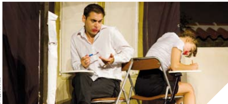
Deux courtes pièces de Feydeau voyagent en Vendée, du 22 mai au 11 juin prochain.

La Vendéthèque de La Châtaigneraie est devenue résidence d'artistes, dans le cadre de l'opération « Feydeau voyage en Vendée », organisée par le Conseil général.