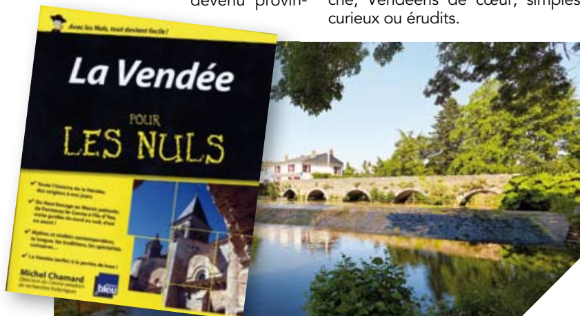
Tous les secrets de la Vendée dévoilés aux lecteurs de la célèbre collection des nuls.

Renseignements: La Vendée pour les nuls , Michel Chamard, First Éditions / 22,95€