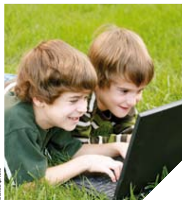
Aujourd'hui, la quasi-totalité des jeunes est intégrée à un réseau social.

les réseaux font d'abord peur aux parents parce qu'ils ne les connaissent pas bien. Leurs enfants, eux,