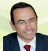
Bruno RETAILLEAU Président du Conseil général de la Vendée

À toutes et à tous, je vous souhaite un très beau salon du Livre.