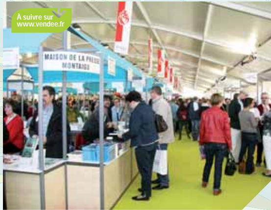
Le Printemps du Livre de Montaigu s'est imposé comme le plus important salon du livre du grand Ouest.

Pas moins de 250 écrivains ont pris rendez-vous avec le public vendéen les 11, 12 et 13 avril 2014 pour la 26 e édition du Printemps du Livre de Montaigu. Un événement littéraire parrainé par Lorant Deutsch. Près de 35 000 visiteurs sont attendus au cours de ces trois jours. Trois jours pendant lesquels ils auront l'occasion de discuter avec leurs auteurs préférés ou d'autres rencontrés au détour d'un stand.