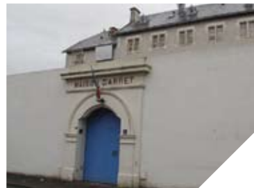
En l'absence de modernisation, la tension s'accroît dans les prisons vendéennes.

Actuellement de petits travaux de mise aux normes sont en train d'être réalisés mais ils risquent de ne pas améliorer la situation puisque trois places seront supprimées. « Aujourd'hui, les personnels n'en peuvent plus, poursuit Bruno Retailleau. Il faut moderniser entièrement les deux prisons vendéennes de La Roche-sur-Yon et de Fontenay-le-Comte et créer un troisième établissement pénitentiaire en Vendée. C'est ce que je continue à demander à la Ministre de la Justice ».