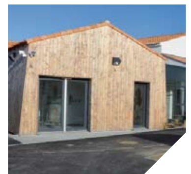
La résidence pour jeunes actifs de Noirmoutier-en-l'île est une solution idéale pour les jeunes en mission temporaire sur l'île.

(Bâtiment Basse Consommation) équipée de panneaux solaires pour la production d'eau chaude sanitaire. L'association Agropolis (Groupe Établères) est en charge de la gestion de la résidence.