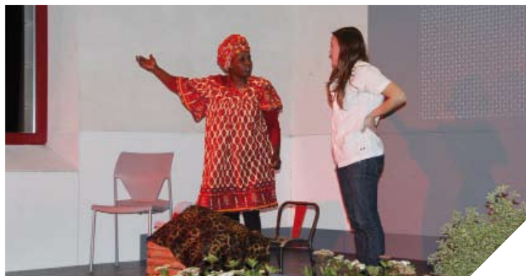
À l'occasion des 20 ans de l'association Pharmaciens Sans Frontières, une troupe de théâtre est venue illustrer les problèmes de médicalisation des populations béninoises.

De la récolte de matériel aux formations, depuis 20 ans, l'association Pharmaciens Sans Frontières de Vendée œuvre au Bénin.