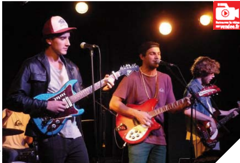
Ici le groupe de musique Léonie, originaire d'Olonne-sur-Mer.