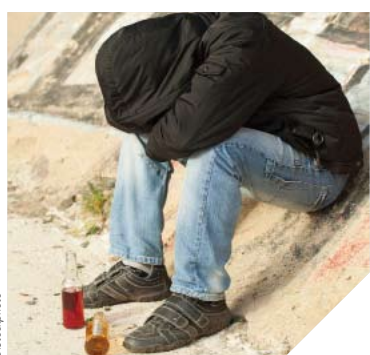
34 acteurs du département unissent leurs forces au sein du Plan alcool.

Conscients que pour lutter contre la consommation excessive d'alcool, ils devaient s'unir, 34 acteurs locaux ont signé un Plan alcool 2014-2016.