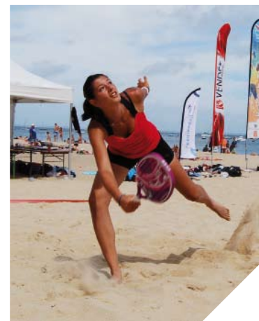
Un club entièrement dédié au Beach Tennis a été créé à Saint-Gilles-Croix-de-Vie.