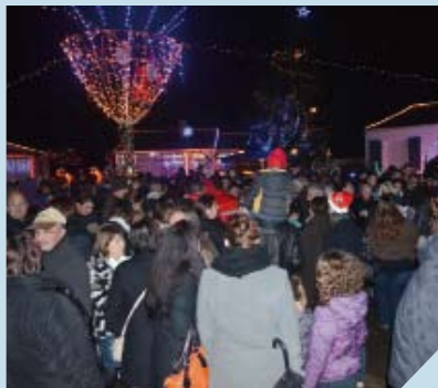
Près de 20 000 visiteurs viennent découvrir le square Lamarck chaque année.