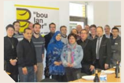
Les boulangers vendéens et québécois multiplient les échanges.