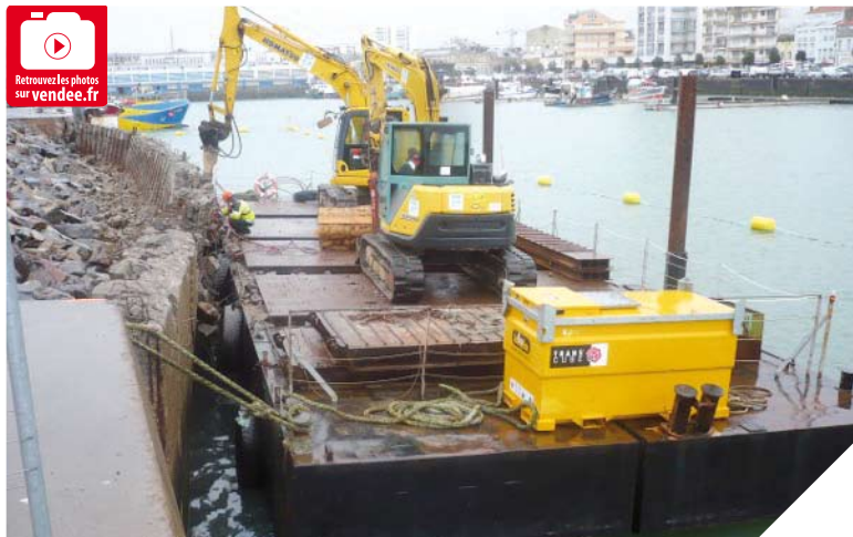
Sur le port des Sables d'Olonne, les travaux d'urgence menés en un temps record ont permis de garantir aux professionnels l'accès au bassin.

En Vendée, ce début d'année a été marqué par de violentes intempéries. Les zones côtières et les secteurs des marais ont particulièrement souffert. Après des interventions menées en urgence, notamment sur le port des Sables d'Olonne et la route de Cayola, le Conseil général lance les travaux de reconstruction.