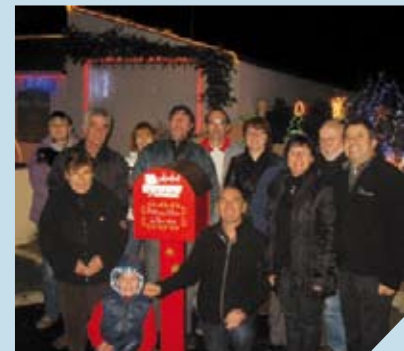
Les habitants du square Lamarck, à Challans.