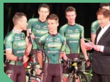
Thomas Voeckler, Bryan Coquard, Pierre Rolland... les grands noms de l'équipe étaient tous là.

Cette année, j'ai vraiment envie de me faire plaisir sur le Tour. Et souvent les résultats vont de pair avec le plaisir », a expliqué Thomas Voeckler. À noter que Bryan Coquard, qui évolue depuis seulement deux ans au sein de l'équipe professionnelle, participera à son premier Tour de France cette année.