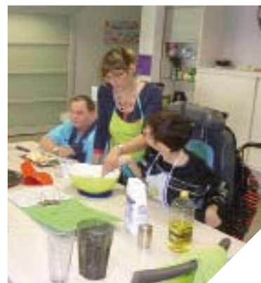
Le nouvel accueil de jour de Luçon permet un accompagnement personnalisé.

le développement de solutions d'accompagnement diversifiées afin de pouvoir disposer de struc-