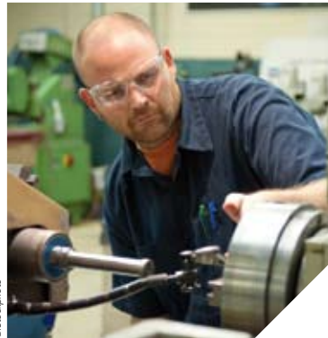
La MDEDE est au service des demandeurs d'emploi et des entreprises qui recrutent.

Les Maisons de l'emploi mènent depuis sept ans, avec efficacité, des actions pour lutter contre le chômage. Or, elles sont aujourd'hui fragilisées par l'arrêt des financements de l'État. « Grâce à des contacts de terrain avec les