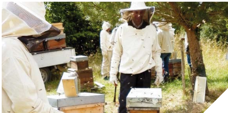
En Vendée, trois centres proposent des formations apicoles de loisir comme ici, à la folie finfarine. Les associations l'Abeille vendéenne et l'entraide apicole en proposent aussi.

Non seulement les abeilles sont indispensables à l'écosystème, mais en plus elles offrent au monde économique un potentiel de plusieurs milliers d'emplois en France.