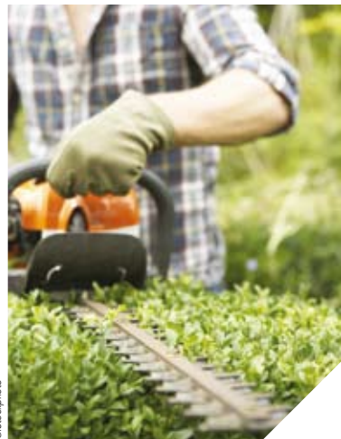
Accompagnée par la plate-forme Initiative, l'entreprise Vent des Jardins a connu un fort développement.

Créer une entreprise est un vrai challenge. Pour accompagner les entrepreneurs, les associations vendéennes du réseau Initiative se mobilisent. En 2013, avec le soutien du Conseil général, elles ont permis de créer ou de maintenir plus de 560 emplois.