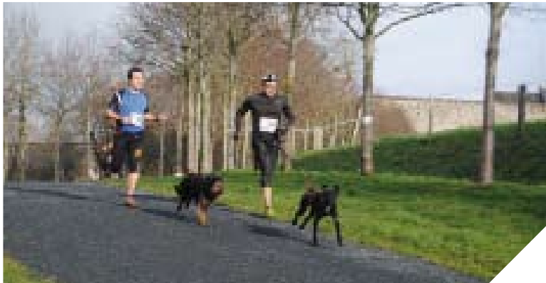
Dans une course de canicross, l'effort est partagé entre le chien et son maître.

Renseignements : 06 88 99 90 19, www.sportcaninolonnais.fr