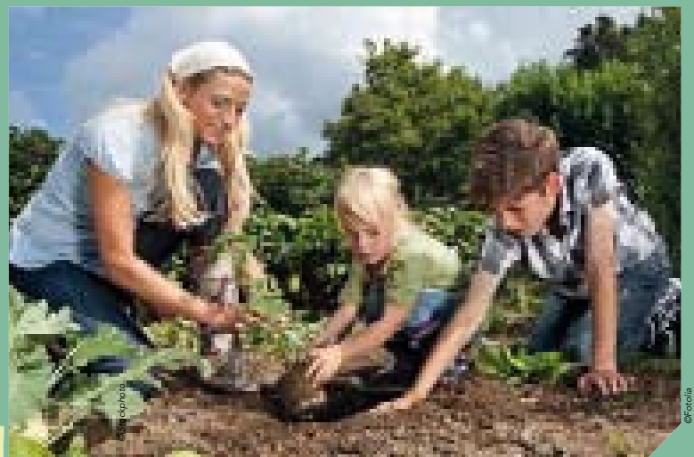
L'objectif du projet Familles bénévoles est de favoriser la transmission du bénévolat.

Parce que la famille est bien souvent le lieu où naissent les vocations de bénévole, le Conseil général lance une opération spécifique dédiée aux familles vendéennes. Vivre en famille le bénévolat est à un moyen de rendre plus efficace cette transmission du bénévolat. Dans le même temps, s'engager ensemble au sein d'un projet bénévole permet de resserrer les liens familiaux et de valoriser l'implication des enfants. Rendez-vous sur benevolat.vendee.fr pour candidater.