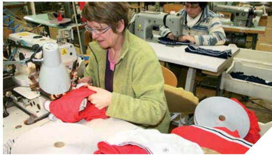
Le Slip français, entreprise créée par un jeune diplômé HEC, est en plein boom. La découpe et l'assemblage du produit sont faits dans l'atelier vendéen de P3C, à Belleville-sur-Vie.

Créée en 2011 par un jeune diplômé d'HEC, la société « Le Slip français » fait le buzz ! Le produit revendiquant sa fabrication 100% française est découpé et assemblé en Vendée. Visite des ateliers de confection P3C à Belleville-sur-Vie.