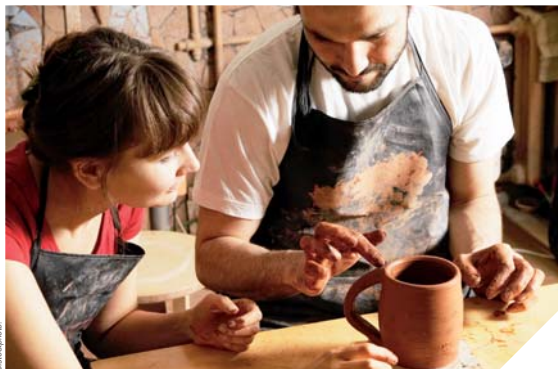
À travers les ateliers de poterie, les personnes réactivent leur imaginaire.

Depuis quelques mois le Centre Hospitalier Georges Mazurelle a ouvert un espace de soins en addictologie. À la tête des équipes de soignants, le docteur Garret, psychiatre explique les mécanismes de l'addiction.