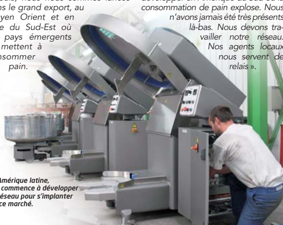
En Amérique latine, VMI commence à développer un réseau pour s'implanter sur ce marché.