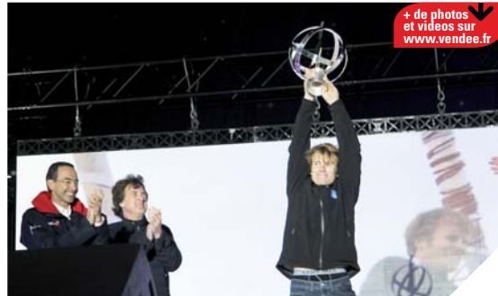
+ de photos et vidéos sur www.vendee.fr

Avant la remise du trophée au vainqueur, le public a également pu découvrir les premières images du film En Solitaire . Avec François Cluzet dans le rôle titre, le film tourné en partie en novembre der-