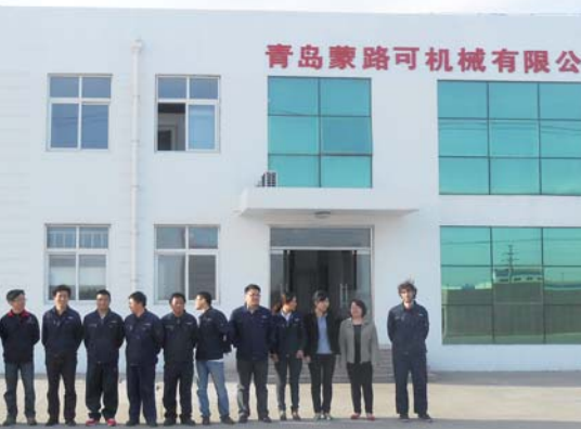
implanté sur le marché asiatique à partir de sa filiale chinoise.