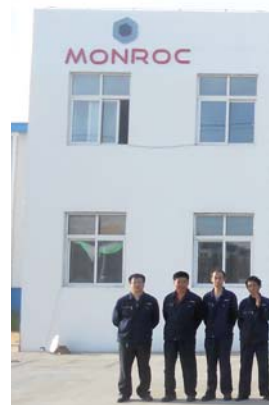
Depuis plusieurs années, Monroc s'est im-

Lorsque nous nous lançons sur un marché, il faut avoir la capacité de