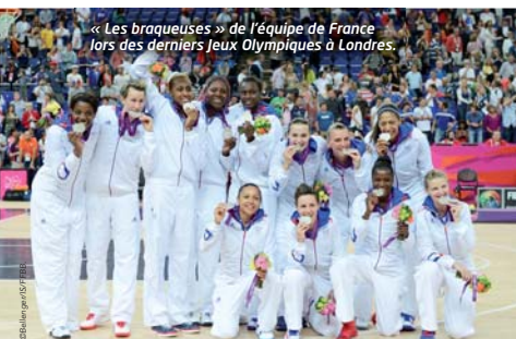
« Les braqueuses » de l'équipe de France lors des derniers Jeux Olympiques à Londres.