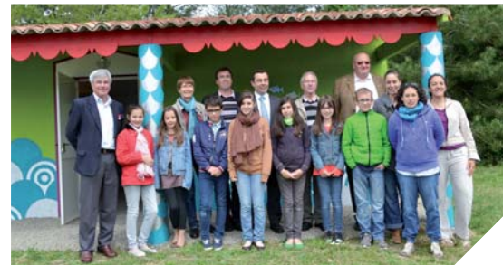
Les jeunes ont donné une nouvelle jeunesse au local de l'étang des Brosses.

Portée par le mouvement Familles Rurales, la Cordée mobilise les générations autour de projets communs. À La Merlatière, la Cordée a ainsi initié une action originale : la réhabilitation du local de l'étang des Brosses. Plus d'une douzaine de jeunes de 10 à 16 ans ont travaillé avec un artiste pour peindre les façades du bâtiment. Rapidement, d'autres habitants de tous âges ont rejoint le projet. Plus qu'un simple projet de peinture, l'objectif était de redonner une nouvelle jeunesse à l'étang des Brosses. L'année dernière, 74 personnes ont partagé leur passion et appris un savoir-faire à travers des ac-