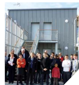
Les élus aux côtés des nouveaux locataires.

Ces cinq logements de type III présentent également des avantages importants en matière de consommation énergétique. En effet, ils utilisent l'énergie solaire pour la production d'eau chaude sanitaire et sont classés en BBC moins de 50 kWh/m 2 . Le projet est le fruit du partenariat