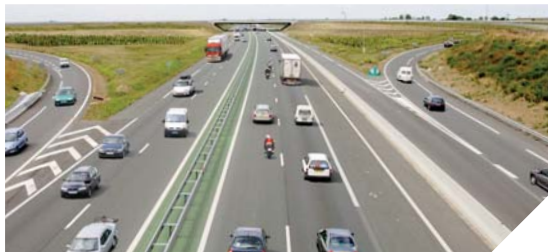
Le projet de l'A 831 permettrait de relier Fontenay-le-Comte à Rochefort.

Pour le sud Vendée, la période est cruciale. L'Etat devrait prochainement indiquer si ce projet d'autoroute entre Fontenay-le-Comte et Rochefort est maintenu. En juin, les Vendéens mais aussi les Charentais-Maritimes sont plus que jamais mobilisés.