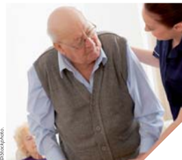
Les auxiliaires de vie viennent en aide à ceux qui ne peuvent plus assurer seuls les gestes quotidiens, quel que soit leur âge.

Lorsque nous ouvrons la porte de chez eux, nous rentrons dans leur intimité. Notre mission est de leur permettre de vivre le mieux possible. Nous devons déclencher une relation de confiance pour savoir ce dont la personne a besoin.