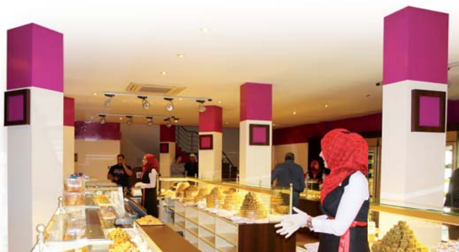
OCF, investit le marché du Moyen Orient. Un défi technique pour ses vitrines réfrigérées.