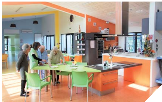
Au sein de l'UPAD, les personnes sont impliquées dans les tâches de la vie quotidienne comme la préparation du dîner.