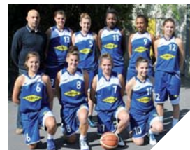
Une association pour unir les entreprises autour du club de basket.

Renseignements : 06 86 43 40 62 http://www.lagarnachebasket.fr/