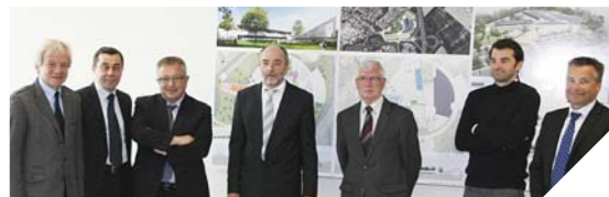
Le cabinet d'architecte dévoile les plans de l'extension du collège Saint-Exupéry en présence des élus.

mencer à l'été 2014 et se terminer en fin d'année 2015. Un nouveau bâtiment d'une superficie de 1100 m 2 sera ainsi construit sur deux niveaux. Il abritera les pôles sciences et arts plastiques. Un nouveau préau viendra remplacer la passerelle actuelle située à l'entrée du collège. Ce bâtiment sera exemplaire sur les économies d'énergie et inséré dans son environnement autour du théâtre de verdure. Un aménagement des espaces extérieurs apportera une plus grande fluidité et une meilleure sécurité pour les piétons et les automobilistes. Aujourd'hui, les collèges sont l'une des priorités d'investissements du Conseil général avec 150 millions d'euros mobilisés dans les cinq ans. Un effort sans précédent en Vendée.