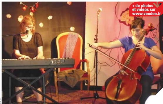
+ de photos et vidéos sur www.vendee.fr

aux ouvrages à emprunter. L'autre moitié est dédiée aux rencontres, aux expositions et aux représentations et aux jeunes talents locaux. « Aujourd'hui, sur la totalité des personnes qui entrent dans les médiathèques, la moitié vient pour les rencontres, les échanges, les expositions, précise Valentin Jos-