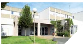
En plus du logement, le FJT Les trois portes propose services annexes et animations.

Renseignements : portes ouvertes le 6 juin, de 10h à 19h, au FJT Les trois portes, 16 rue des gravants, à Fontenay-le-Comte.