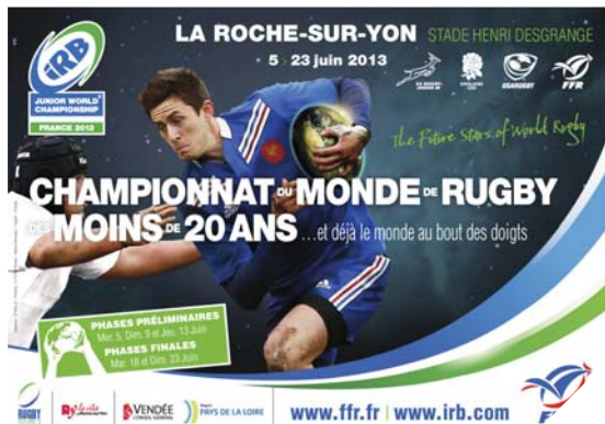
Le championnat du monde de rugby des moins de 20 ans démarre le 5 juin.

Renseignements : retrouvez le détail des matches et l'accès à la billetterie sur www.ffr.fr