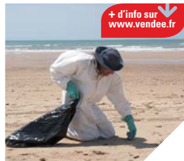
Les plages vendéennes souillées par le naufrage de l'Erika en 1999.

L'article proposé déclare que « toute personne qui cause un dommage à l'environnement est tenue de le réparer ».