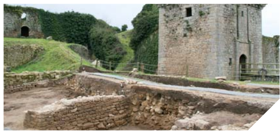
Les sous-sols de Tiffauges cachent de véritables trésors historiques.

Ce chantier prouve que le sous-sol du château de Tiffauges est un véritable livre d'histoire et regorge de trésors archéologiques. La roche n'a pas encore été atteinte. Il doit y a des traces d'habitations antérieures au Moyen Âge. De nouvelles fouilles devront être programmées.