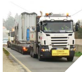
En février, un convoi de 266 tonnes a sillonné la Vendée.

Mardi 26 février, l'un des plus importants convois parcourt les routes vendéennes en direction de La Merlatière. Un transformateur EDF est transporté grâce à un convoi spectaculaire composé d'un camion tireur, un camion pousseur et une remorque avec plus de seize essieux. Au total, le convoi fait 266 tonnes.