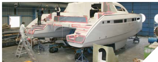
Les deux premiers catamarans construits dans les locaux sablais depuis l'automne rejoindront l'Australie.