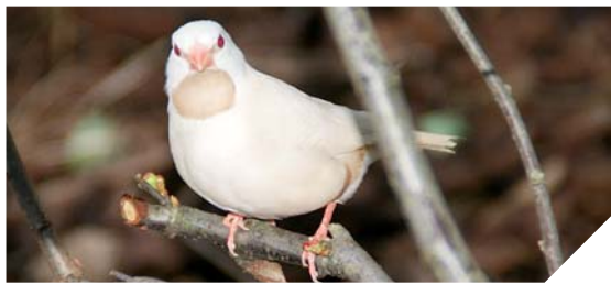
Plumage clair, élégance, finesse: autant de qualités qui ont fait de cette Miss une championne.