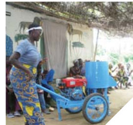
Grâce à la mobilisation du comité des femmes et de l'Ademaf des outils sont mis à disposition des initiatives économiques locales.