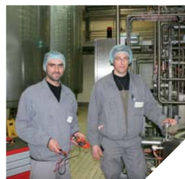
Technicien de maintenance : des débouchés dans tous les secteurs d'activité.

Ils permettent à l'ensemble des outils de l'entreprise d'être performants : les techniciens de maintenance sont les anges gardiens indispensables à la régularité de la production des sites industriels. « Je suis tombé par hasard dans la maintenance, ex-