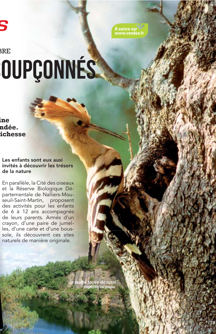
La huppe faciée dit aussi papotte ou pupu.