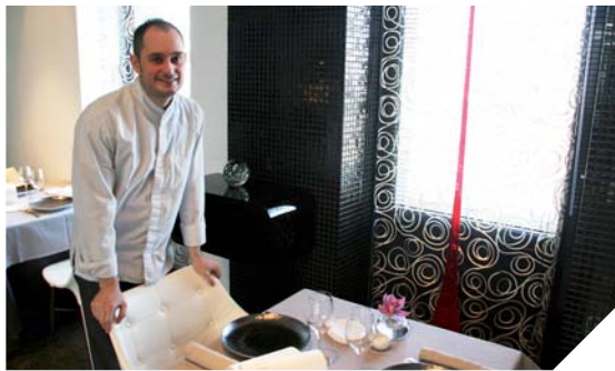
Les menus sont élaborés en fonction des arrivages et de la qualité des poissons qu'apportent les pêcheurs à la criée de Noirmoutier ils dépendent aussi des légumes fournis pour les producteurs.

Nous sommes ouverts aux remarques. C'est très important pour nous d'avoir le retour des clients. Nous avons absolument besoin de savoir ce qu'ils pensent de nos produits. Si on ne nous dit pas ce qui ne va pas, on ne peut pas le deviner ! Je préfère le client qui à la fin du repas nous dit ce qu'il a moins apprécié plutôt que de retrouver des messages désagréables et anonymes sur les réseaux. C'est plus constructif !