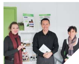
L'équipe de Salvia, basée aux Clouzeaux.

ROUTES / SÉCURITÉ DES TRANSPORTS EXCEPTIONNELS