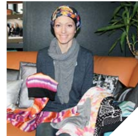
Un bonnet permet aux femmes de retrouver le plaisir de prendre soin d'elles.

Un simple bandeau surmonté d'une longue bande de tissu à nouer autour de la tête. En un tour de main, l'affaire est réglée. Chic et féminin, ce bonnet a été créé par Alexandra Quenault pour les femmes qui ont perdu leurs cheveux : en tant que socio-esthéticienne, je rencontre de nombreuses femmes qui ont perdu l'estime de soi après une maladie et des traitements qui les ont épuisées. Elles se sentent physiquement dégradées. Elles ont parfois besoin d'un simple petit coup de pouce pour reprendre confiance en elle et retrouver le plaisir de prendre soin d'elles ». Le bonnet noué, un petit coup de blush et des boucles d'oreilles, Alexandra Quenault leur propose une manière toute simple de réveiller leur beauté