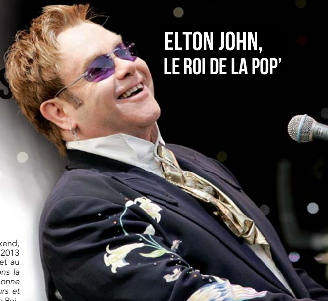
ELTON JOHN, LE ROI DE LA POP'