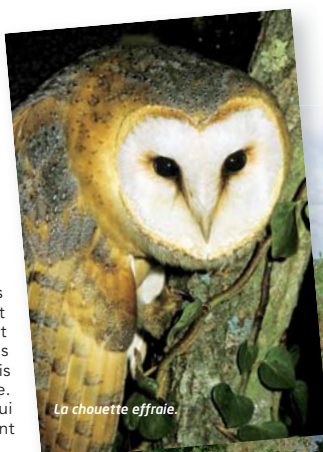
La chouette effraie.

En parallèle, la Cité des oiseaux et la Réserve Biologique Départementale de Nalliers-Mousséil-Saint-Martin, proposent des activités pour les enfants de 6 à 12 ans accompagnés de leurs parents. Armés d'un crayon, d'une paire de jumelles, d'une carte et d'une boussole, ils découvrent ces sites naturels de manière originale.