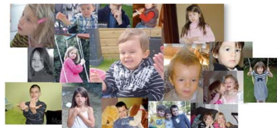
L'association Autisme Sans Frontières 85 dispose désormais d'un lieu unique d'accueil.

NATATION / CHAMPIONNAT DU MONDE PARALYMPIQUE