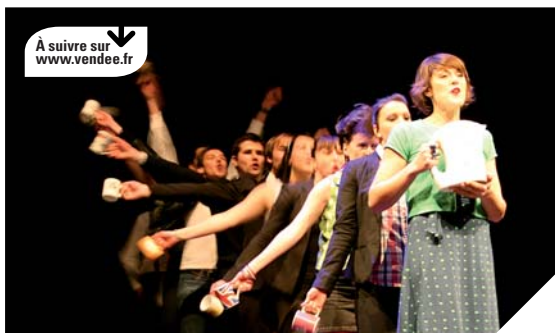
La Vendée Recrute ses Talents a remporté un grand succès auprès du grand public.

Le 7 au 13 mars, le taux d'adrénaline est monté d'un cran dans les couloirs de la Longère de Beauport pour les cent vingt artistes en herbe ou déjà reconnus localement qui sont passés devant le jury du concours La Vendée Recrute ses Talents. Opération originale lancée par le Conseil général, le concours a remporté un grand succès. « L'objectif est de détecter de jeunes talents et de les aider à s'améliorer et à se produire, préci-