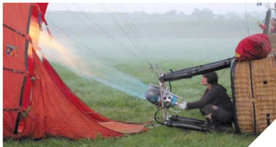
De la préparation au sol, au vol en altitude, tout émerveille la jeune pilote de montgolfière Clarisse Murail. « Je ne fais qu'un avec mon ballon ».

lage et suivre mes collègues en voiture ». Aussi bien au sol, pour gonfler le ballon, que dans les airs, tout est magique. « Le silence, la sérénité, la beauté des paysages, nous effleurons les cimes des arbres. Une fois j'ai pu cueillir une pomme de pin. Au lever du jour, nous voyons les animaux sauvages qui rentrent sous couvert... ».