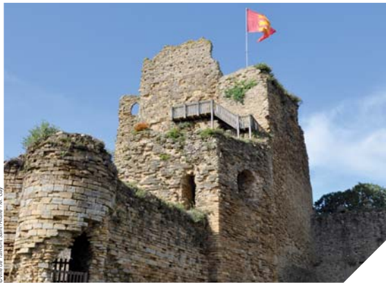
Le château de Talmont a connu une période particulièrement faste du XI e jusqu'au début du XIII e siècle.

Au fur et à mesure des fouilles et des études, le château de Talmont-Saint-Hilaire livre ses secrets. Types de constructions, habitudes de consommation, rôle de Talmont comme centre de pouvoir: les découvertes sont nombreuses et passionnantes.