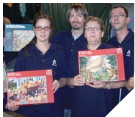
Les membres de l'équipe Eureka 85 présentent les puzzles réalisés lors de la compétition en Belgique.

Ils étaient sept Vendéens au dernier tournoi des 24 heures du puzzle en Belgique. Compétition unique au monde qui réunit plus d'une centaine d'équipes,