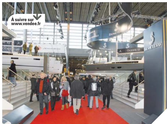
Les chantiers Jeanneau et Beneteau ont profité du Salon nautique de Paris pour présenter de nombreux nouveaux modèles.

« En Vendée, on dénombre 90 entreprises de nautisme ».