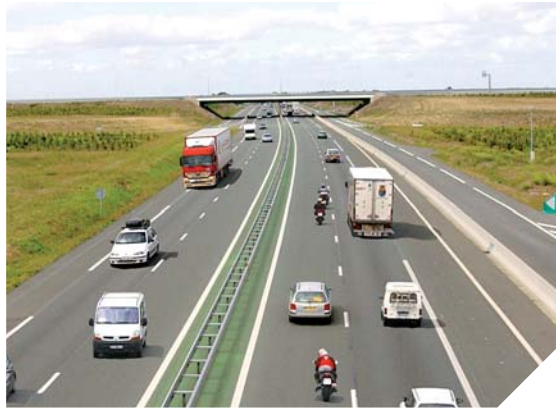
Le transporteur MTA a notamment choisi de s'implanter sur le Vendéopôle de Bournezeau parce qu'il est idéalement situé, à proximité des grands axes routiers.

Et de cinq! En 2012, une cinquième entreprise accompagnée par Vendée Expansion a choisi de s'implanter en Vendée. Le groupe MTA (Messageries et Transports de l'Atlantique) installe une agence sur le Vendéopôle de Bournezeau.