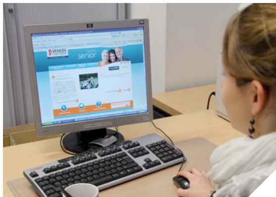
Le site http://vendee-senior.fr répertorie plus de 200 solutions d'accueil pour les personnes âgées.

À partir d'une carte de la Vendée, l'internaute peut localiser les différentes solutions d'accueil: familles d'accueil, établissements non médicalisés ou EHPAD ».