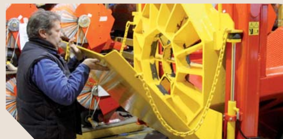
Une dizaine de nouveautés par an sortent des ateliers Rabaud de Sainte-Cécile.

modèles réduits pour les collectionneurs ou lancement d'un nouveau stand au salon de l'agriculture prouvent que chez Rabaud, l'innovation est plus qu'un slogan !