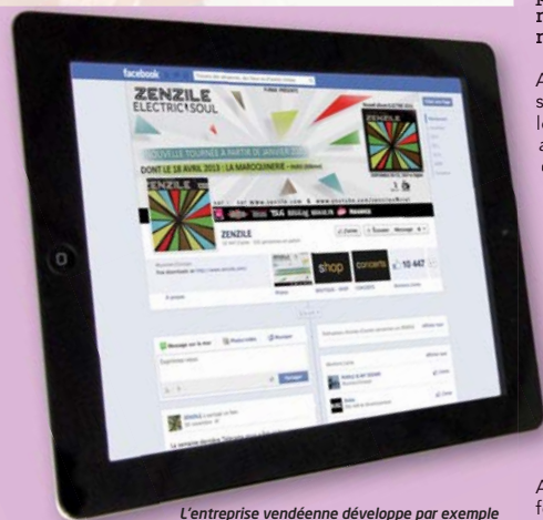
L'entreprise vendéenne développe par exemple des boutiques en ligne sur les réseaux sociaux.

chefs d'entreprises déjà très impliqués à l'export, poursuit Wilfrid Montassier. Ils rassembleront les chefs d'entreprise intéressés par l'international et proposeront des actions à mettre en œuvre pour les aider. La Chambre de commerce et d'industrie et Vendée Expansion pourront mettre en place ces actions jugées prioritaires ».