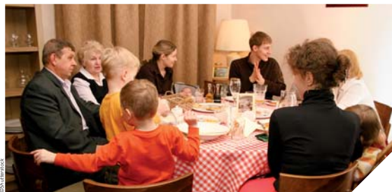
Les parents sont parfois démunis face aux problèmes quotidiens qu'ils rencontrent. Des groupes de paroles leur permettent de découvrir des outils pour faire face et reprendre confiance dans leur rôle.

Lors de la première réunion, les parents exposent leurs attentes