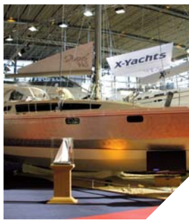
Dans les allées du salon, les entreprises vendéennes présentent leur savoir-faire.

Aux côtés des leaders de l'industrie nautique vendéenne tels que Jeanneau et Beneteau, plusieurs chantiers navals, entreprises d'accastillage et d'équipement ont profité du salon nautique de Paris pour présenter leur savoir-faire et leurs innovations aux visiteurs, professionnels et particuliers, venus nombreux.