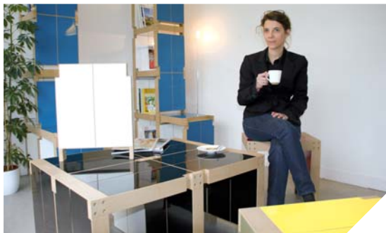
Couleurs variées, formes multiples, le lem de Fabulem renouvelle les intérieurs.

Installée aux Herbiers depuis quelques mois, l'entreprise Fabulem, à travers son lem, propose de renouveler l'idée du meuble.