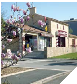
En quelques années, le centre-bourg de Sainte-Foy s'est transformé. Des bâtiments ont été réhabilités et de nouveaux commerces sont apparus.

poraires. Trois résidences en maintien à domicile ont également été construites à côté de la maison de