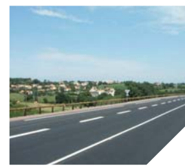
Le contournement routier apporte plus de sécurité aux bourgs de Chaillé et Vouillé-les-Marais.

Ce contournement permet aux usagers d'éviter la traversée des bourgs de Vouillé-les-Marais et de Chaillé-les-Marais. Ces derniers pourront ainsi retrouver un peu de calme et de sécurité. Les pics de fréquentation de cette