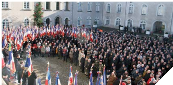
550 porte-drapeaux étaient réunis au Conseil général pour la journée nationale d'hommage aux morts pour la France des combattants d'Afrique du Nord.

En s'adressant à tous les anciens combattants présents, le président du Conseil général a enfin déclaré : « vous tous, vous êtes les sentinelles de cette mémoire ».