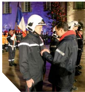
La Sainte-Barbe a été l'occasion de remettre des médailles d'honneur aux sapeurs pompiers au service de leurs concitoyens depuis de nombreuses années.

Le 14 décembre, à l'occasion de la cérémonie de la Sainte-Barbe, un hommage particulier a été rendu aux 75 chefs de centre de secours de Vendée et à leurs adjoints. Ambassadeurs plénipotentiaires des Sapeurs-Pompiers auprès des élus, des entreprises et des populations, ils jouent un rôle capital pour le bon déroulement des secours et l'harmonie entre les soldats du feu.