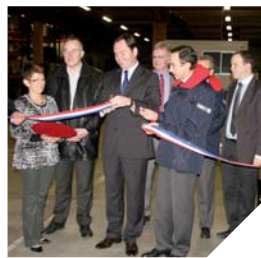
Les dirigeants de Leduc-Lubot, Bruno Retailleau et les élus locaux inaugurent les nouveaux locaux de l'entreprise.

La société Leduc-Lubot s'est installée depuis la fin du mois de novembre dans les 18000 m 2 des anciens entrepôts Thoinard à Saint-Martin-de-Fraigneau. Créée à Fontenay-le-Comte en 1837, la société Leduc-Lubot commençait à se sentir à l'étroit