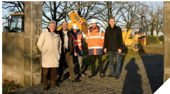
Un cimetière fictif, permet aux élèves de s'entraîner aux techniques en grandeur nature.

Première en France, l'École des Techniques de Cimetière vient d'ouvrir à Belleville-sur-Vie. Déjà sept personnes y suivent la formation. Mis en place par les formations Marionneau en collaboration avec l'entreprise Funepus, les premiers cours ont débuté à l'automne. L'objectif est de former 40 à 50 personnes par an.