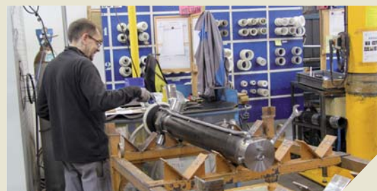
Les deux sites de production de Sertta se trouvent à Mouilleron-le-Captif et emploient 250 personnes.

Créé en 1971, Sertta, conçoit et fabrique des vérins hydrauliques. Depuis quelques années, l'entreprise s'investit à l'export avec succès.