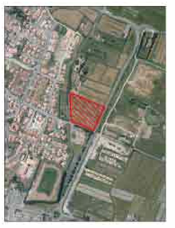
Plan des réseaux projetés